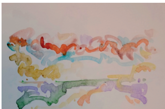
Étude 3, per a oboè, veu i soroll