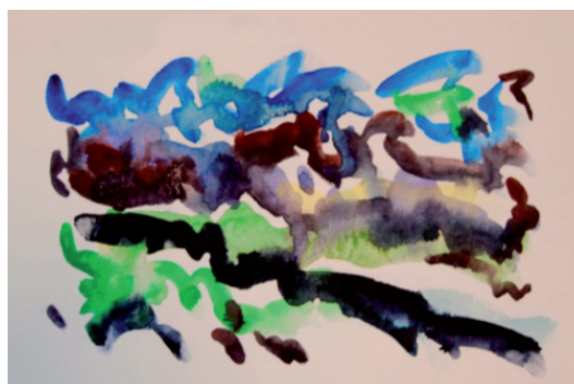
Étude 4, per a oboè i gravació en cinta